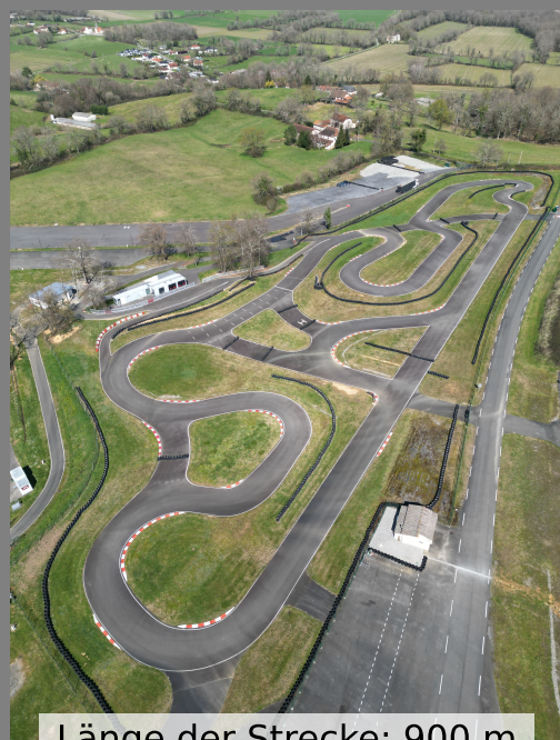
Länge der Strecke: 900 m

Open Pitlane und eine stark eingeschränkte Teilnehmerzahl sorgen für maximalen Fahrspass. Und das ist genau so gewollt.