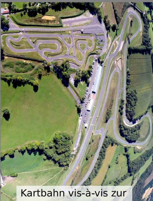
Kartbahn vis-à-vis zur "großen" Rennstrecke

Wir wollen keine zeitlich festgeschriebenen Turns und keine überfüllte Strecke. Fahr einfach wann du willst, solange du willst. Und der Hammer kommt jetzt: